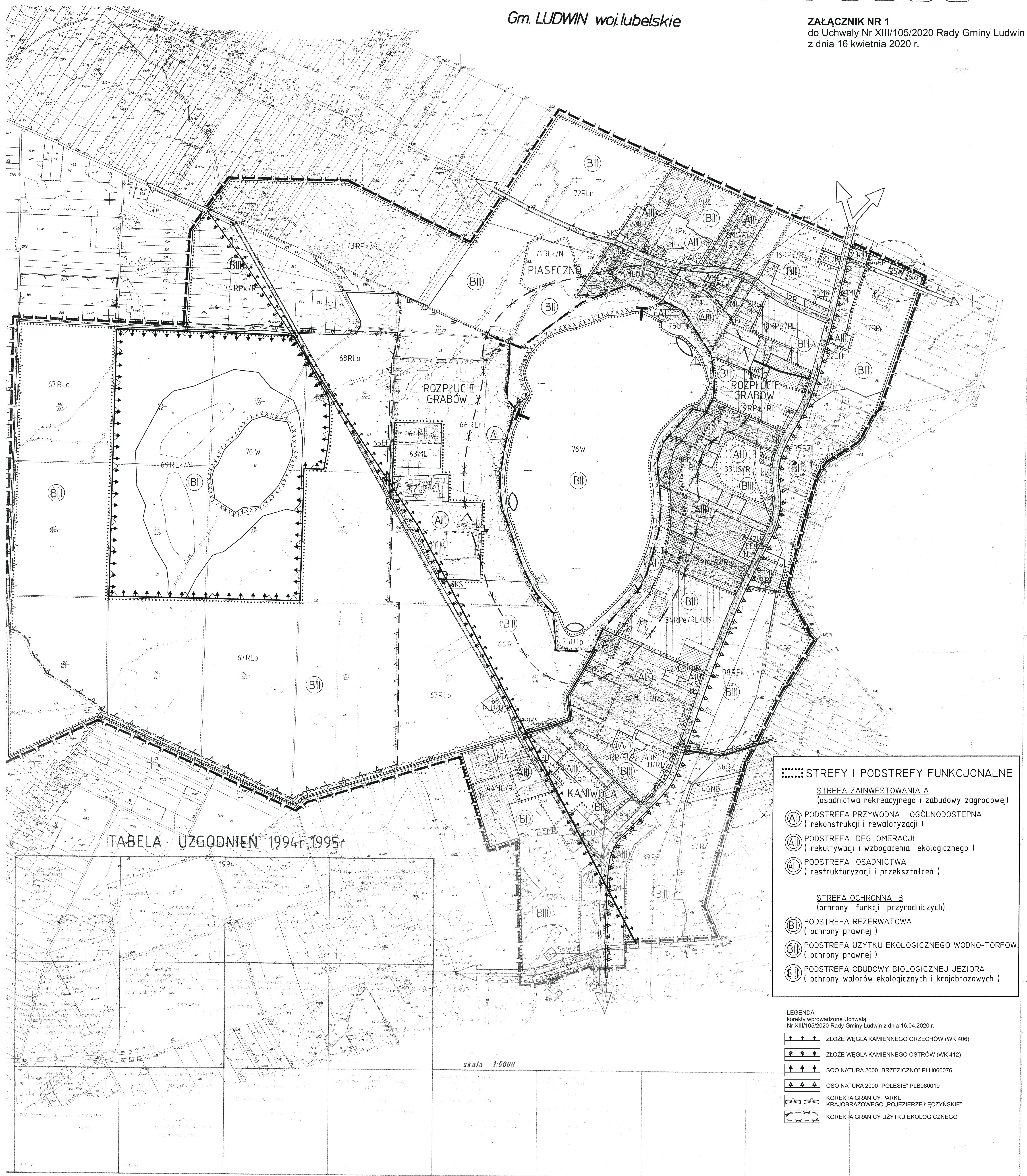
TABELA UZGODNIEŃ 1994r, 1995r

ZAŁĄCZNIK NR 1 do Uchwały Nr XIII/105/2020 Rady Gminy Ludwin z dnia 16 kwietnia 2020 r.